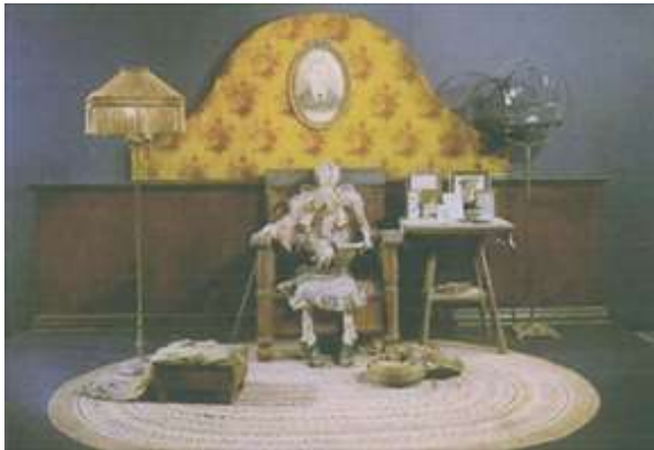
Edward Kienholz: Das Warten 1964/65

Großvaters Unterricht oder hier die Familiengruppe, Kind, Tochter, Großvater. Diese Sicht ist abgelöst worden durch einen modernen Realismus. Da hat mich dieses Bild sehr beeindruckt: Das Warten.